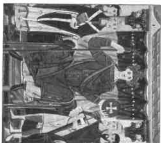
III. Ottó uralkodói öltözködése az ing fölött viselt hosszú, szegélydíszes tunika, valamint a vállon ékzserrel rögzített köpeny (X. sz. vége)

Alapvető darabjai az alsó- és felsőruha, a szűk nadrág és a köpeny. A korai középkor frank viselete szerint az alsóruha hosszú ujjú, övvel viselt ing, a felsőruha is ing, de térdig érő, tunika jellegű. Nyaka kerek vagy szögletes kivágással készült. Ujjai eleinte szűkek, majd később letele bővítték. Jellegzetessége a szegélydísz volt.