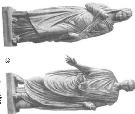
① Stóia és pallia a császárokhoz (Faustina szobra, II. sz., Párizs) ② Túnika és toga (Cato szobra, II. sz., Róma)

Kedvelték az ékszereket. Csatok és fibulák az öltözködhöz, fülbevalók, függők, gyűrűk, láncok, karpercek a gazdag megjelenés kellemésként készültek. Nemesfémeket, drágaköveket, élelőfémeket, üveg- és zománccremeket viseltek szívesen.