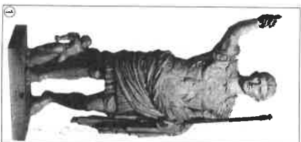
1 Augustus császár (Kr. u. 20. körül, Róma)

A festészetet a lakóházak falain megmaradt színes, görögös freskókból ismerjük. Alapvetően hasznosították a festészetet a lakóházak falain megmaradt színes, görögös freskókból ismerjük. Alapvetően hasznosították a festészetet a lakóházak falain megmaradt színes, görögös freskókból ismerjük.