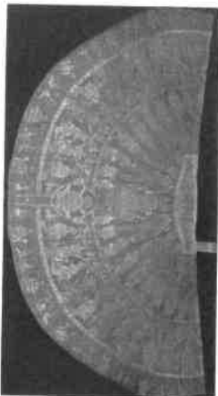
Koronázási polást (1031. Eredetileg miseruha volt, Budapest)