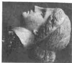
Szobrokkal díszített, görög korony (Aphrodite-fej) Kr. e. V. sz., Fülde