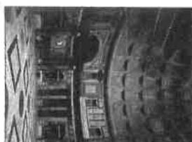
A Pantheon belülről (Kr. u. 120 körül, Róma)

Róma népe nagy élvezettel ünnepelt és szórakozott. Diadalmeneteket vonultak a győztesek (Tritusz