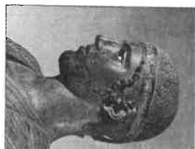
Homlokpánttal övezett sportolójai A delphoi kosziolói feje, Kr. e. V. sz., Delphoi

ellen széles kaímájú, csúcsos szalmakalapokkal védekeztek. A férfiak ápolat hajukat kezdetben világító, később rövid, göndör formában viselték. A sportolók homlokpántot, az utazók lapos tetejű petaszoszt, a munkások pedig fejhez simuló, karima nélküli pilioszt viseltek.