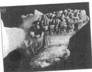
③ Rövid hajt és korszakall (Caracalla portrészobra, Népoly) ④ Szines agyagszobrocska palliában, csúcsos kalappal, és legyezővel (Kr. e. IV. sz. körül, Berlin) ⑤ Császárnői női hajviselet (Róma)