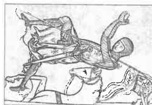
► Keresztes viléző a XII. századból

A XIII. századra elterjedt a hosszú, bokáig érő tornma. A nadrág lábfejjel vagy anélkül készült harisnya-nadrág forma. A különálló harisnyarészt fűzőkkel erősítették az inghez, és szíjakkal (esetenként a láb-