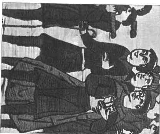
Bayeux-i kárpit részlete (XI. sz., éjtsz. bojót)