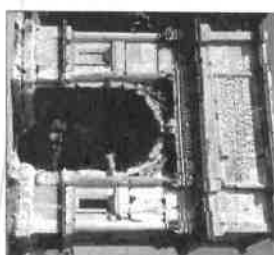
Titus diadalíve (Kr. u. 80–85, Róma)