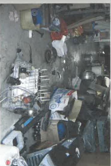
22. ábra. Munkahelyi rend?