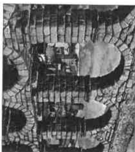
Római vízvezeték (Kr. u. I. sz., Segovia, Spanyolország)

A római városépítészetben sok újítást alkalmaztak. A kövezett út alatt csatorna vezetett. A vízellátást árkád sor tetején vezetett vízvezetékkel (aquadukt) oldották meg. Padlófűtéses lakóházak, villák átriumos udvar köré épültek. Közútdörök és sportcsarnokok szolgálták a testkultúrát. A közelet központja a fórum, reprezentatív tér a város központjában, középületekkel, templomokkal.